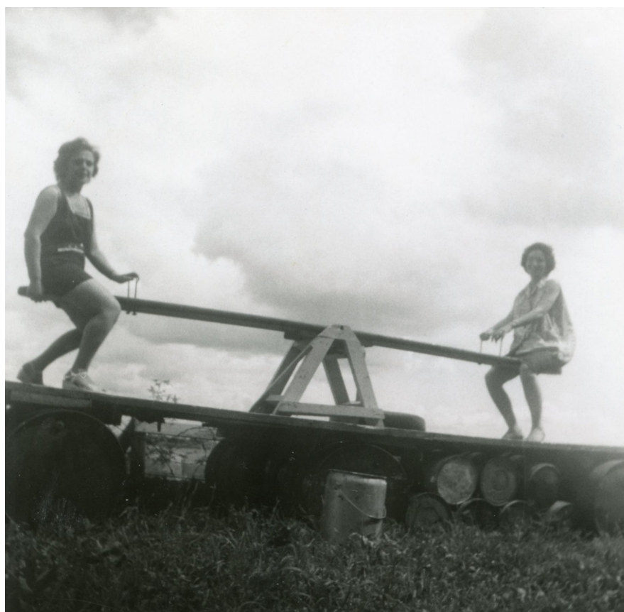
Deux femmes sur une bascule – Juillet 1956