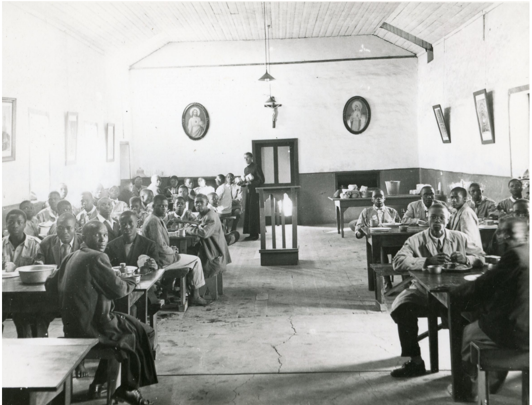
Un groupe de séminaristes africains au réfectoire, avant le départ pour les vacances d'hiver – Date inconnue