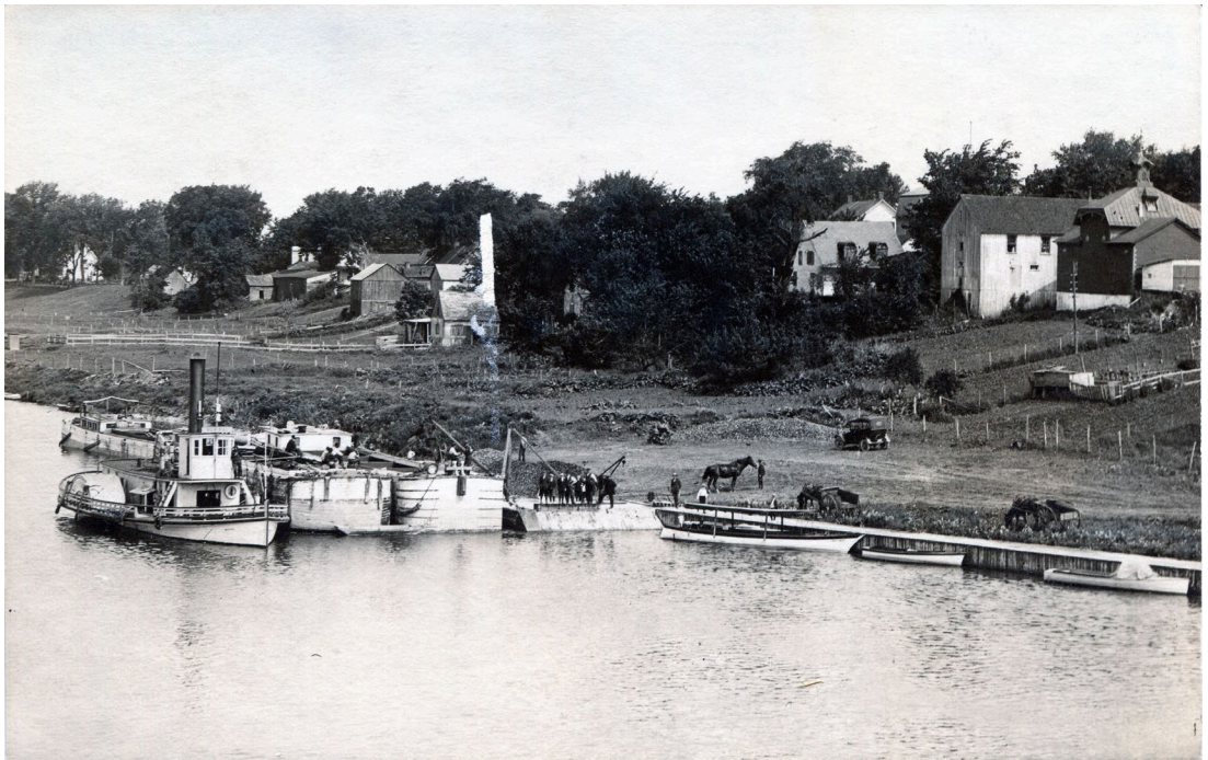
Bateaux au quai du port de Nicolet – 1917